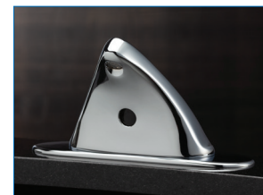
Centres de 10,16 cm (4 po) Centres de 20,32 cm (8 po)

Modèles disponibles avec un approvisionnement double et un mitigeur mécanique ou un mitigeur thermostatique pour la protection contre les brûlures. Disponible également en approvisionnement unique.